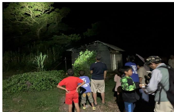
図2 悪石島で実施された夜間見学会の様子

2023年4月に中之島で開催した講演会では、インターネット会議アプリを活用し島外とも接続したため、屋久島や口永良部島、鹿児島市からの参加があった。講演会終了後、会場付近のガジュマルで観察会を行い、飛来した個体を観察した。2023年7月の悪石島では、講演会の他に、子供会の会合に合わせて夜間観察会を実施した。観察会では歓声上がるなど、本亜種の観察機会が少なかった住民、特に子供たちへ与えたインパクトは大きかった(図2)。