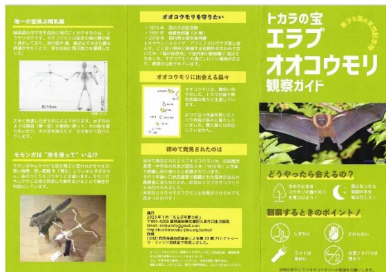
図1 十島村全戸に配布した「エラブオオコウモリ観察ガイド」リーフレット(表面)

情報提供の一つとして、トカラ列島の本亜種の生態を紹介する「トカラの宝 エラブオオコウモリ観察ガイド」(A4 三つ折りリーフレット)を作成し、トカラ列島十島村の全370世帯に配布した(図1)。リーフレットには、本亜種の特徴、餌や食べ方、餌場やねぐら、生殖活動や出産・子育てなど生態情報を記した。